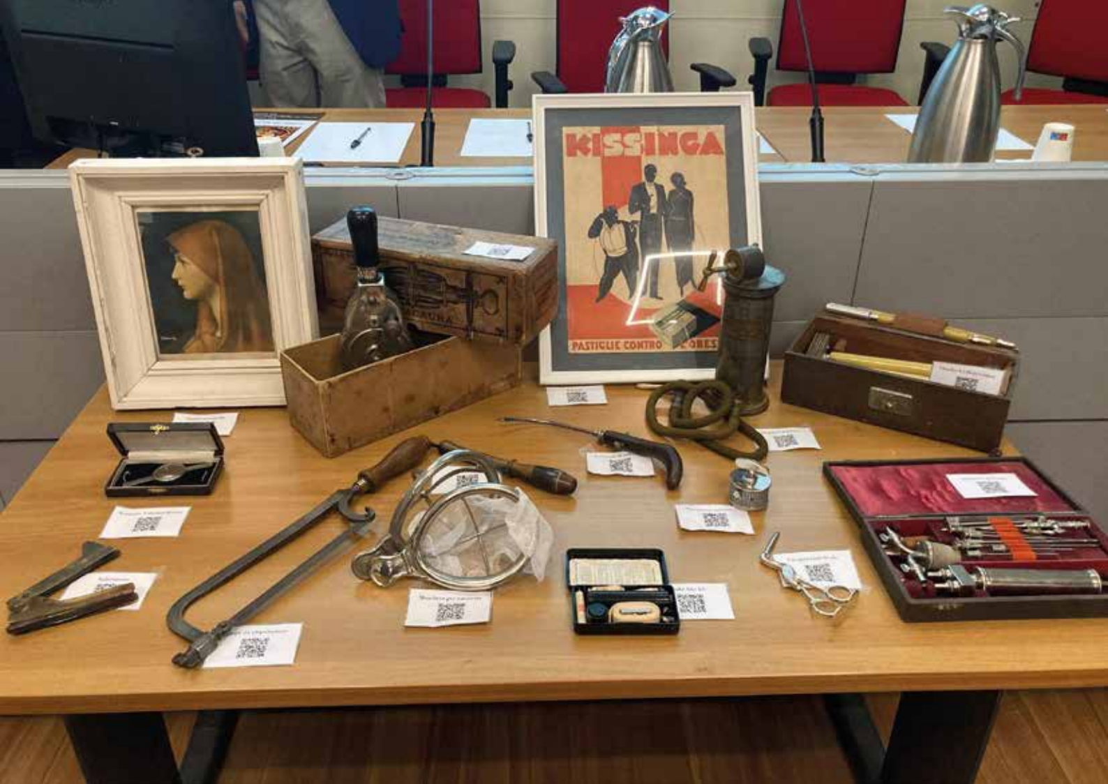
Spiegazione nel testo

e scientifiche avvenute in Europa nei secoli dell'Illuminismo hanno generato ansie e tensioni nei popoli, ed il potere politico e religioso hanno saputo incanalarle verso un capro espiatorio. L'avvento della modernità ha portato alla rivalutazione della figura femminile ed oggi la grande partecipazione femminile al mondo della medicina e della ricerca apporta la propria visione ampia, empatica, curiosa e rivolta all'ambiente, che darà sicuramente un'impronta al sistema di cura del futuro. Dalle streghe ai maghi: Duccio Buccicardi (Savona) ha illustrato Vita, morte e miracoli del tedesco Franz Anton Mesmer (1734-1815) , il primo dei maghi moderni, celebre per la teoria del "magnetismo animale" secondo cui un fluido invisibile influenzava la salute umana. Studiò medicina a Vienna e sviluppò tecniche basate su magneti e suggestione per curare i pazienti, ottenendo grande fama ma anche critiche. Trasferitosi a Parigi, divenne noto per le sue