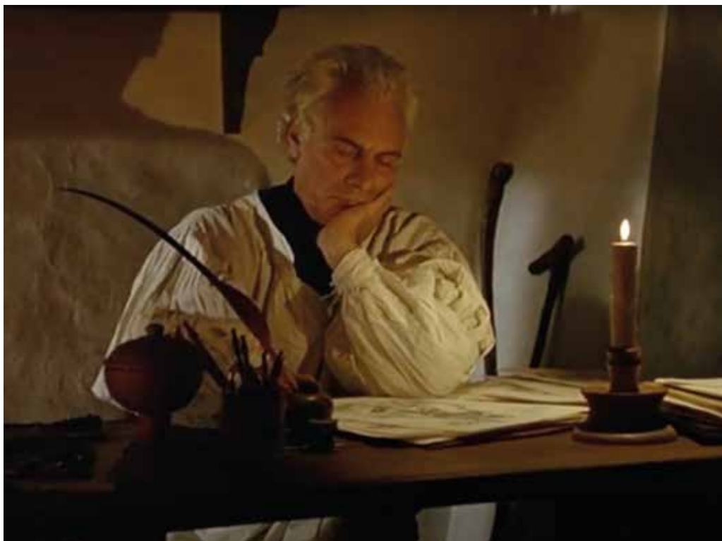
Gian Maria Volontè in un fotogramma del film "L'opera al nero" di André Delvaux, 1988

né in Odontoiatria. Come fare per controllare i titoli di un presunto Medico o Odontoiatra? Basta consultare il sito https://portale.fnomceo.it/cerca-prof/ e digitare il nome e il cognome oggetto di ricerca; l'assenza, in siffatto portale, può dipendere da tre motivi: 1) i dati sono stati digitati in maniera non corretta; 2) il soggetto ricercato non è laureato e/o abilitato all'esercizio della professione; 3) il soggetto è attualmente sospeso o radiato. Per non parlare, poi, di specialità e titoli millantati ma non posseduti, di pubblicità ingannevole, suggestiva e/o comparativa, dell'uso improprio del titolo di Prof. e del cosiddetto "turismo sanitario". Tutte situazioni per le quali l'Ordine esercita un'attività di vigilanza costante, pur avendo – come noto – le mani legate relativamente alla possibilità dell'autosegnalazione, almeno finché non vi saranno i Decreti attuativi della Legge Lorenzin di riforma degli Ordini che porteranno, finalmente, a dicotomizzare la composizione del Consiglio dell'Ordine da quello del Consiglio di Disciplina. Da ultimo si ricorda il contrasto alla ciarlataneria di Avvocati e Medici Legali che prestano attività professionale gratuita per conto di Società ed Enti di vario tipo che si occupano, con un meccanismo a catena, di por-