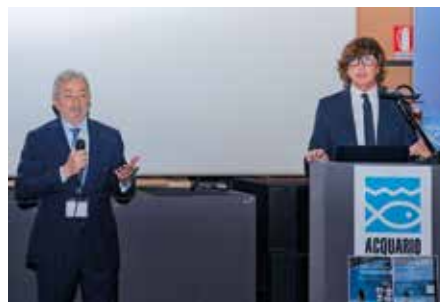
Il Vicepresidente Vicario ANDI Nazionale Corrado Bondi

... fare di più non significa fare meglio... in un contesto, complesso, veloce, di modernità clinica, saper scegliere terapie, strumentario e tecniche orientate al rispetto del paziente può fare la differenza.