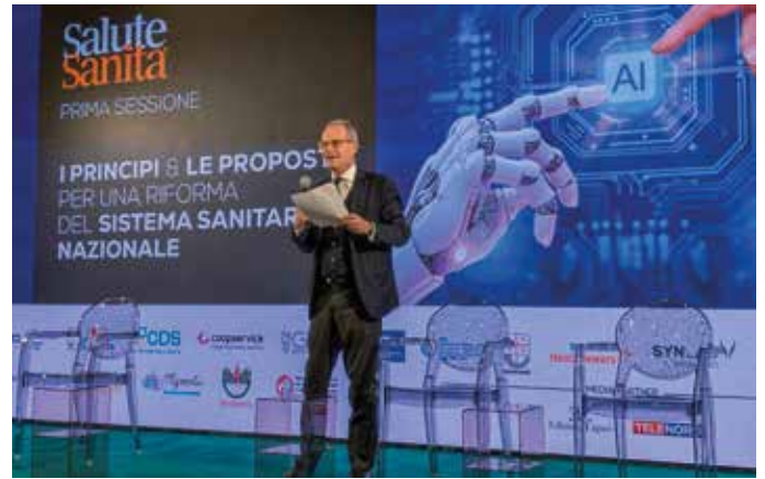
L'intervento dell'On. Matteo Rosso al Convegno Salute e Sanità

C ome categoria professionale ordinistica abbiamo avuto modo di partecipare ad un importante evento e di poter significare alcune peculiarità di noi dentisti.