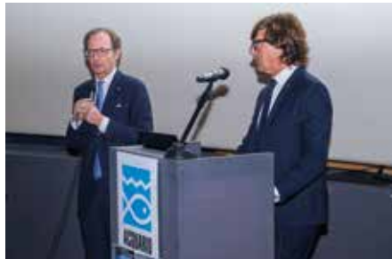
L'Assessore Regionale Massimo Nicolò

Una vera e propria festa di primavera all'insegna di CULTURA, ISTRUZIONE ma altresì AMICIZIA modi eccellenti per legare e condividere il SAPERE con vecchi e nuovi amici e colleghi... l'anima portante del nostro congresso.