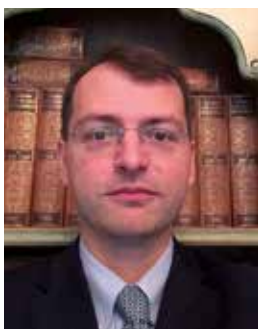
Eugenio Piccardi Studio Associato Giulietti Ragionieri e Dottori Commercialisti

C on la prossima dichiarazione dei redditi relativa all'anno di imposta 2024, i contribuenti, titolari di reddito di impresa o lavoro autonomo, si troveranno nuovamente alle prese con il concordato preventivo biennale.