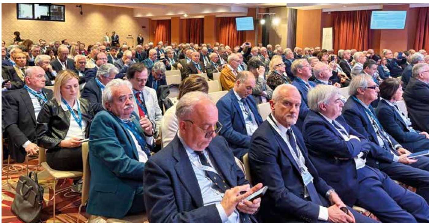
La platea gremita dell'Auditorium dell'Hotel Villa Pamphili