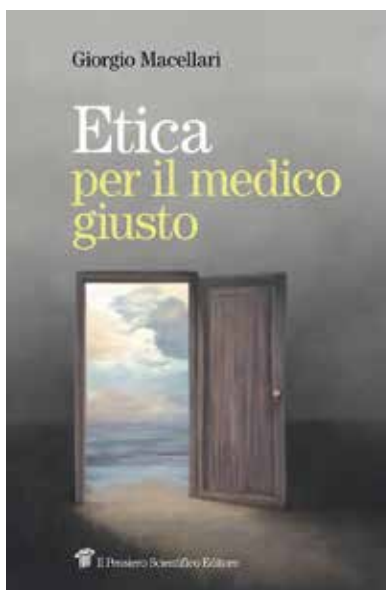
Etica per il medico giusto Giorgio Macellari Il pensiero Scientifico Editore

Un medico l'etica se la trova davanti ogni giorno: non solo quando affronta le fasi terminali della vita, magari interpellato per azioni eutanasiche, ma anche quando guarda negli occhi una persona che soffre, la tocca per visitarla, trasmette cattive notizie, formula una prognosi e traccia un destino.