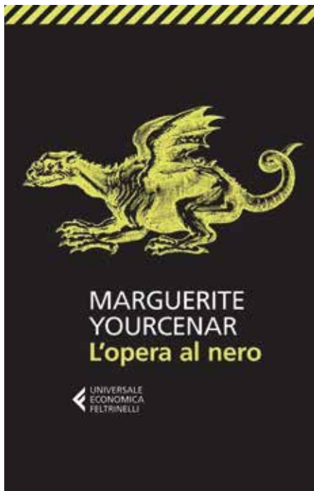
Spiegazione nel testo