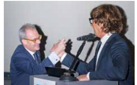
L'On. Matteo Rosso

APPROPRIATEZZA & MINI-INVASIVITÀ sono state le due parole chiave del nostro Congresso: approcci semplici e predicibili che permettano una gestione snella ed efficace del paziente e dell'attività clinica quotidiana.