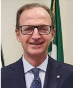
Massimo Nicolò Assessore Regionale alla Sanità