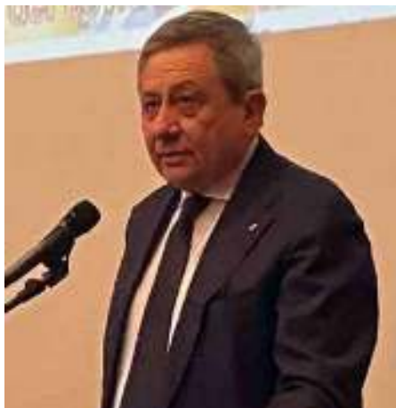
Il dr. Carlo Ghirlanda, Presidente Nazionale ANDI

vati a larga maggioranza con inoltre alcune raccomandazioni di modifiche che verranno recepite e valutate dalla Commissione Statuto preposta; gli articoli statutari saranno quindi ripresentati in una prossima Assemblea dedicata insieme al relativo nuovo regolamento aggiornato.