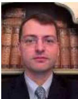
Eugenio Piccardi Studio Associato Giulietti Ragionieri e Dottori Commercialisti

Il 31 dicembre 2024 è stata pubblicata la Legge N. 207 del 30 dicembre 2024, cosiddetta Legge di Bilancio 2025. Di seguito sono riepilogate alcune delle disposizioni contenute nella stessa.