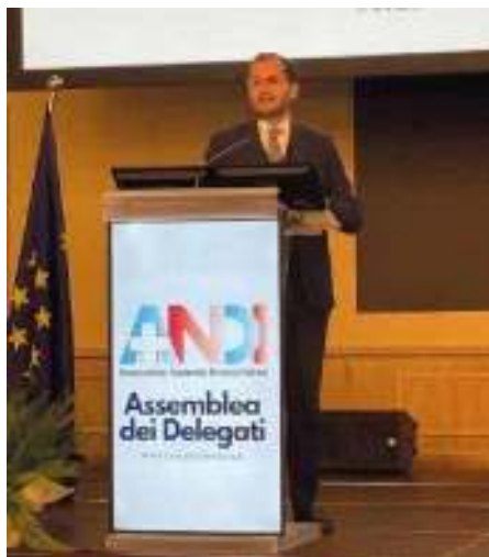
I saluti del Viceministro Gemmato

vati a larga maggioranza con inoltre alcune raccomandazioni di modifiche che verranno recepite e valutate dalla Commissione Statuto preposta; gli articoli statutari saranno quindi ripresentati in una prossima Assemblea dedicata insieme al relativo nuovo regolamento aggiornato.