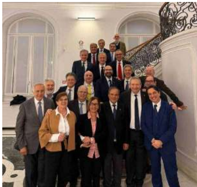
Il Comitato Centrale