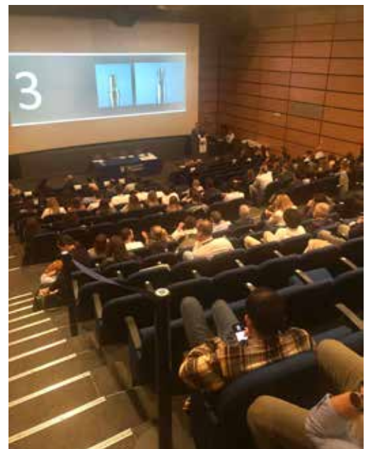
La platea del Congresso dell'Acquario di Genova