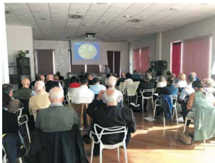
La numerosa platea di Odontoiatri e Medici