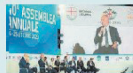
L'intervento di Schillaci

La carenza dei medici di famiglia, gli organici sempre più tirati degli ospedali, la crisi del pronto soccorso, i medici a gettone e i posti nelle scuole di specialità. Tutti problemi, in qualche caso emergenze, che l'Ordine dei medici di Genova ha posto al ministro della Salute Orazio Schillaci durante l'incontro, riservato, di ieri pomeriggio con il presidente Alessandro Bonsignore, il numero uno degli odontoiatri liguri Massimo Gaggero e quasi tutti i consiglieri, oltre al genovese Matteo Rosso, responsabile na-