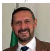
Presidente ANDI Progetti