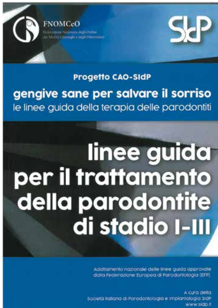
L'opuscolo del Progetto CAO-SIdP distribuito a tutti i discenti

Sono 30 milioni gli italiani con un'inflammatione più o meno grave delle gengive, ma solo il 17% dichiara di aver ricevuto diagnosi e appena il 3% si è sottoposto ad una terapia adeguata.