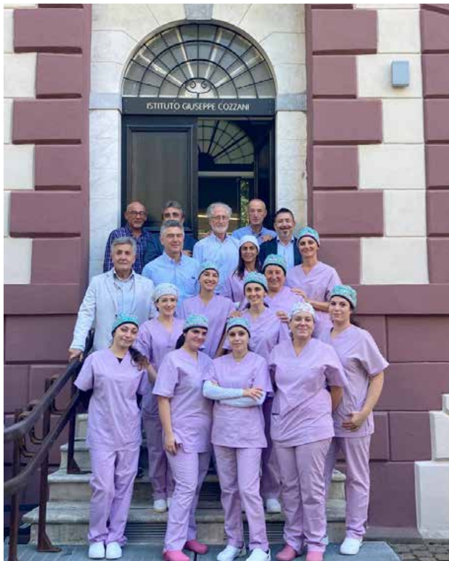
Docenti e discenti del Secondo Corso ASO della Spezia

A conclusione della formazione, le aspiranti ASO, hanno acquisito competenze, abilità e soprattutto una qualifica molto richiesta in ambito sanitario, in grado di assicurare un'occupazione stabile per il supporto alla professione del dentista, in continua crescita e innovazione.