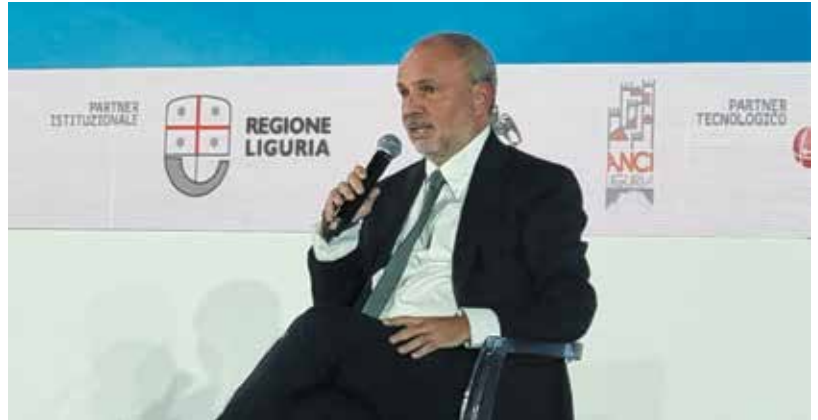
Il Prof. Orazio Schillaci, Ministro della Salute a Genova

Non è un caso che, negli ultimi anni, l'OMCeO della Provincia di Genova abbia lavorato moltissimo sul fronte istituzionale e la presenza del Ministro On. Prof. Orazio Schillaci (a distanza di alcuni anni dalla precedente visita dell'allora Ministro On. Beatrice Lorenzin), presso la nostra Sede, per oltre 3 ore, a fine ottobre, ne testimonia il successo non solo su scala locale e Regionale, ma anche nazionale.