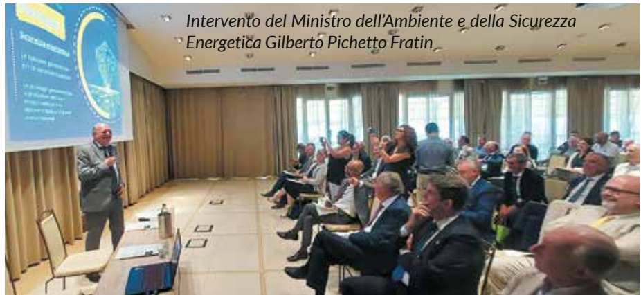
Intervento del Ministro dell'Ambiente e della Sicurezza Energetica Gilberto Pichetto Fratin

Coprono solo il 2% del fabbisogno e sono tutte in Toscana. «Il potenziale nazionale è enorme»