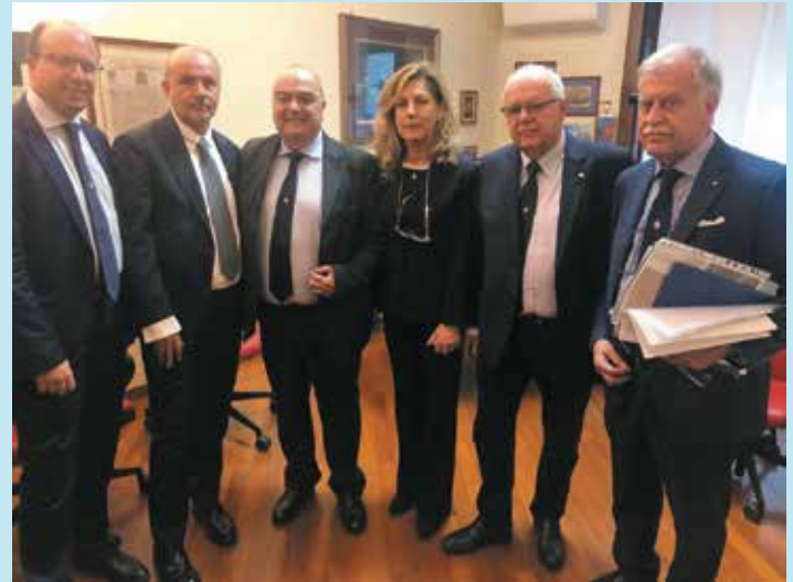
L'Esecutivo dell'Ordine con il Ministro Schillaci

Durante i colloqui in cui si è parlato di questi importanti aspetti e delle problematiche dei Medici, abbiamo affrontato anche alcuni aspetti dell'Odontoiatria in particolare quello rela-