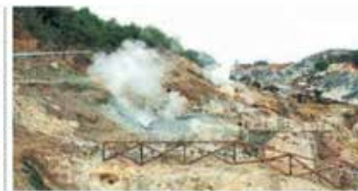
Fuoriuscita di vapore geotermico a Montedotondo Marittimo, Toscana

sta fonte energetica», è la sintesi di Bruno Della Vedova, presidente dell'Unione geotermica italiana, Ugi. Alla geotermia, tecnologia che usa l'energia termica del sottosuolo per produrre corrente o per riscaldare e raffreddare gli edifici, era dedicato il convegno di Confprofessioni organizzato ieri a Genova. L'ospite più atteso, il ministro per l'Ambiente e la Sicurezza energetica Gilberto Pichetto Fratin, ha ribadito l'interesse del governo ma non ha promesso una nuova legge più semplice né un organismo nazionale che promuova il settore. Il geotermico italiano copre oggi circa il 2% del fabbisogno energetico nazionale, e proviene da 36 centrali tutte in Toscana. «Ci sono altri 43 progetti di centrali fermi in attesa del via libera. In media, dalla presentazione del progetto alla produzione