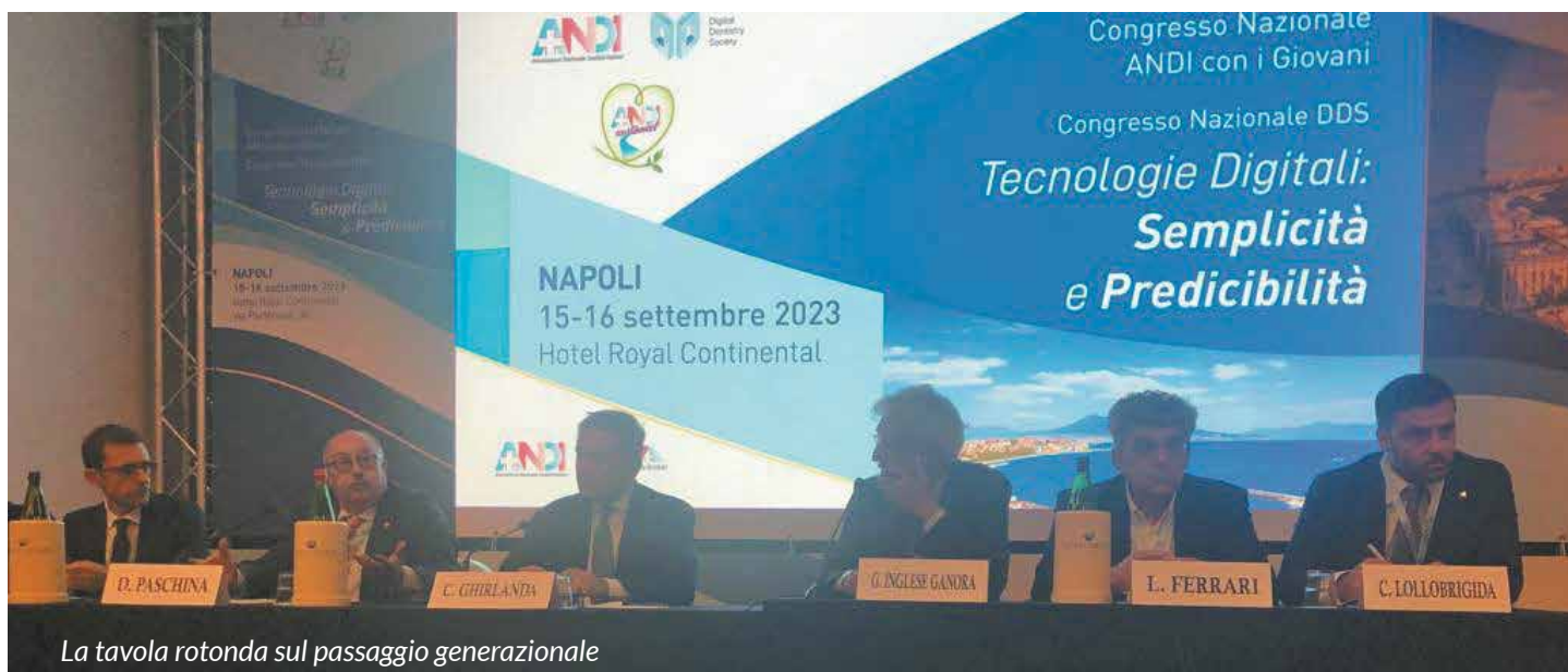
La tavola rotonda sul passaggio generazionale

Cultura, Innovazione, Sindacato dei Giovani e per i Giovani: si può così riassumere l’evento di Napoli, all’insegna di una Associazione moderna e sempre al passo con i tempi.