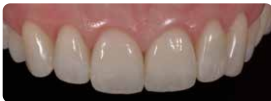
Le faccette in ceramica dopo la cementazione