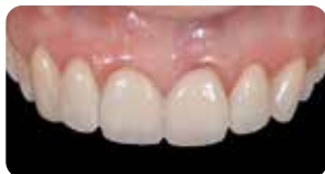
Prova faccette con Try-in Gel