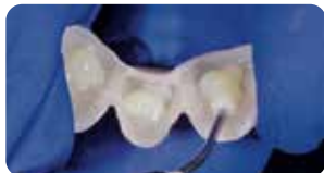
Applicazione Ena Soft Flow per la cementazione dei provvisori