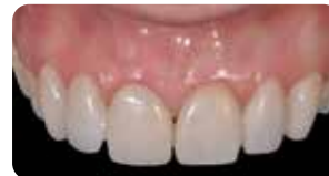
1 settimana dopo: il provvisorio è perfettamente integrato e i tessuti sani