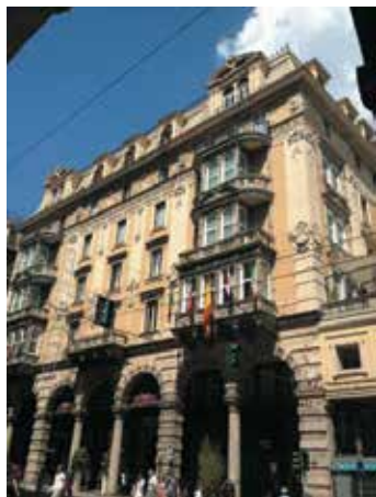
Hotel Bristol di Via XX Settembre