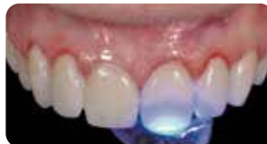
Polimerizzazione per 60 secondi