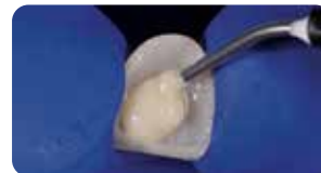
Applicazione di Ena Cem HV , dopo sabbatura, mordenzatura, silanizzazione e applicazione di Ena Seal