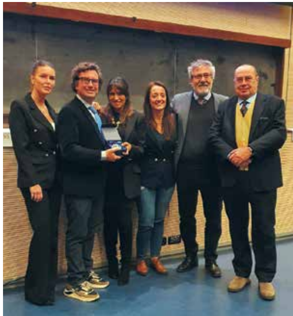
Gli organizzatori e i relatori del Convegno SIOI

La partecipazione è stata numerosa con soddisfazione degli organizzatori e della S.I.O.I. stessa.