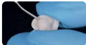
Applicazione Try-in gel nelle faccette in ceramica per prova colore