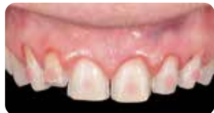
Mordenzatura a spot e applicazione Ena Seal per cementazione provvisorio

Ena Cem HV è un composito flow, fotopolimerizzabile, ad alta viscosità, messo a punto dal Dr. Lorenzo Vanini, che valorizza l'estetica delle faccette sia in ceramica che composito. L'alta viscosità e la alta tissotropia garantiscono una perfetta manipolazione per una facile applicazione e rimozione degli eccessi.