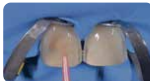
Cementazione faccette: fase adesiva con Ena Bond per 40 secondi